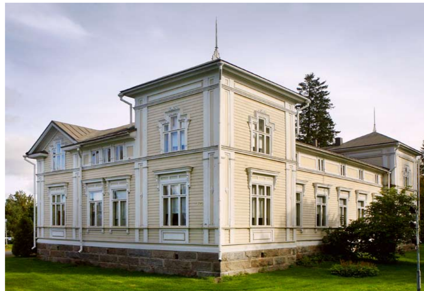
Herkoolin kartanon päärakennus ehti konkurssinsa jälkeen toimia kuutisenkymmentä vuotta kyläkouluna. Nyt se on kartanohistoriaa vaaliva pitotalo.