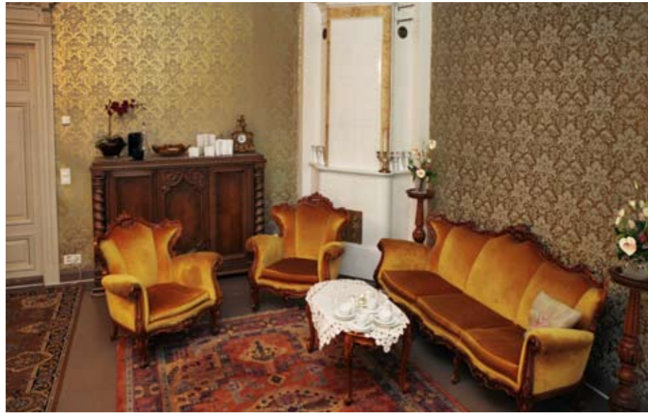
Huonekalut jäljittelevät mahdollisimman tarkoin kartanoaika, joka alkoi 1870-luvulla ja päättyi 1920-luvun alussa.