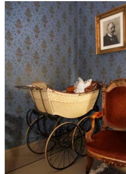
Kartanonisännän huone. Yrittäjien henkilökohtaista esineistöä Herkoolissa on muun muassa mummolan tulipalosta 1920-luvulla pelastetut vauvanvaunut.

tutkinto. Parhailaan hän jatkaa opintoja yrittäjyyden ja liiketalouden ylemmän AMK-tutkinnon parissa Seinäjoen ammattikorkeakoulussa.