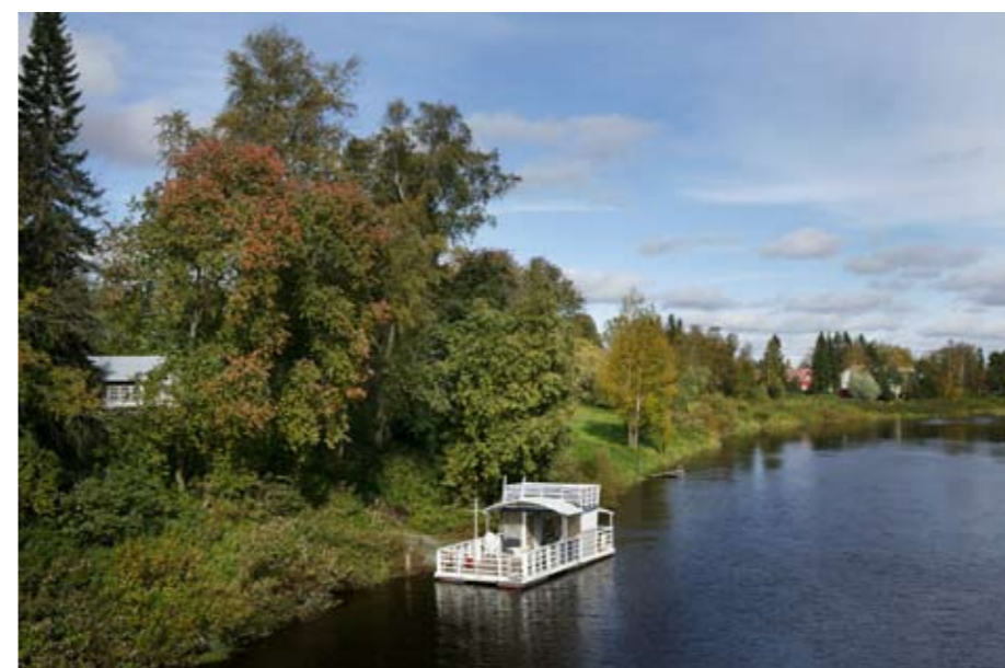
Jokilaivalla järjestetään kesäisin pienten ryhmien tilaisuuksia.