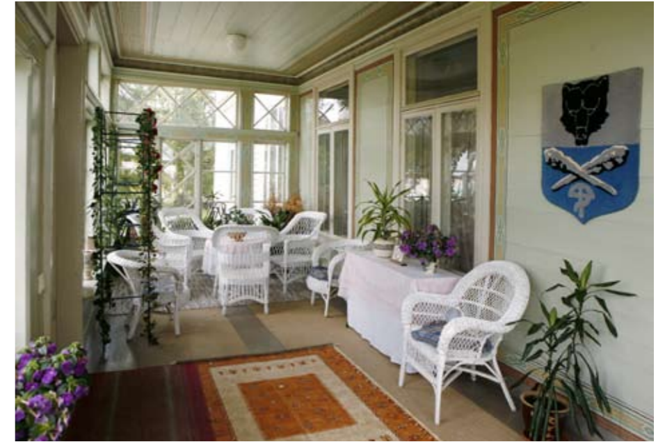
Kevyt korikalusteet sopivat kartanon kuistiin.

Moni haluaa pitää juhlaansa Herkoolissa, koska monilla on jotain yhteyttä talon menneisyyteen. Esimerkiksi niin, että