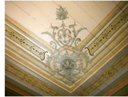
Kattomaalaukset ovat alkuperäisessä asussaan päärakennuksen valmistusvuodelta 1893.